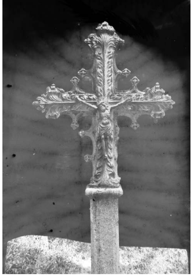
Joan Vidal i Ventosa. Creu de terme d'Amer , c. 1920. Arxiu Fotogràfic de Barcelona.

Uns anys més tard, tot aprofitant la reforma urbanística de la plaça del monestir duta a terme per l'ajuntament de la vila, el Museu Diocesà encarrega una còpia de la creu amb la finalitat de ser col·locada a la plaça, concretament al capdamunt de la Rambla del Mones-