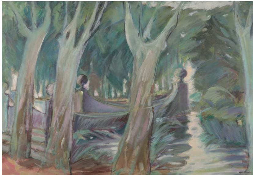
Figura 1. Mercè Huerta, il·lustració per a La Girona dels poetes (1988), a cura de Narcís-Jordi Aragó.

Museu d'Art de Girona. Núm. reg. 131.623 Dipòsit Generalitat de Catalunya. Col·lecció Nacional d'Art